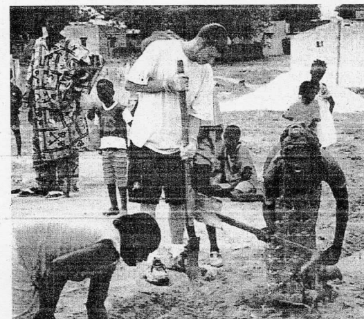
En 2006, l'association a construit un site d'accueil pour les voyageurs étrangers.

L'association organise à travers les différents voyages préparés, différents chantiers auxquels participent les voyageurs. En 2001 l'association a pris part à un chantier international Franco-Italo-Sénégalais qui a réuni 120 personnes au Sénégal pour un reboisement, un projet maraîcher, plus la réfection de l'école dans le village de Nguith. En 2002, ce fut 13 jeunes de Palabres et 13 jeunes Guinéens qui se sont retrouvés pour un grand chantier itinérant. De l'année 2003 à 2005 l'association s'est engagée dans un projet de développement durable au Sénégal, et 2006 à la construction du site d'accueil de visiteurs étrangers dans le cadre du tourisme solidaire, toujours au Sénégal. Une grande aventure attend les futurs voyageurs avec cette association dynamique et qui ouvrira certainement le coeur de l'Afrique au plus grand nombre.